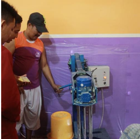
Foto : Cara memasak supaya kemasannya menjadi menarik