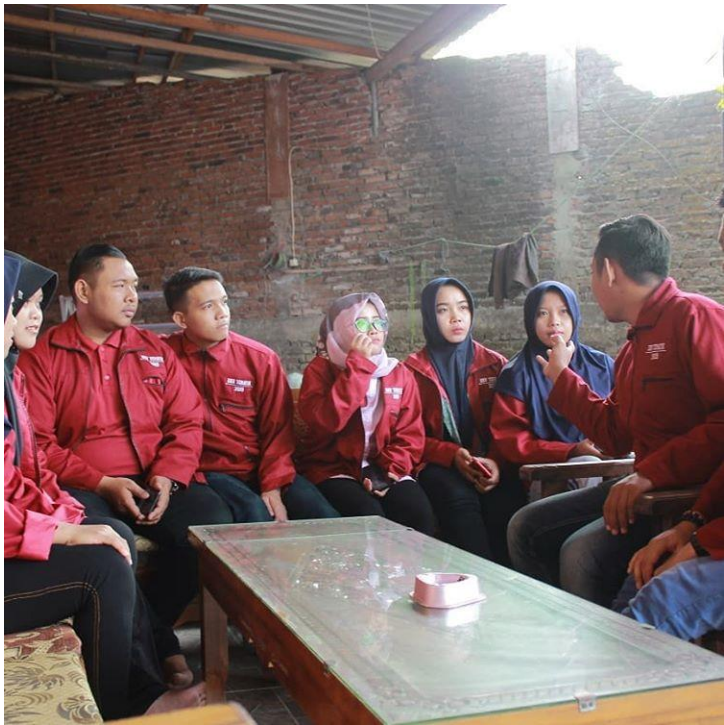
Foto : Mengatur strategi cara menyampaikan kepada pengusaha

Pelatihan merupakan pemberian pembelajaran secara nyata melalui kegiatan sosialisasi yang berhubungan dengan tujuan hasil yang ingin dicapai dalam hal pemasaran atau promosi. Mitra diberikan pemahaman tentang beberapa indikator penunjang promosi diantaranya : penentuan harga (price), Pemantapan Produk (Product), Penempatan Distribusi dan Proses Pemasaran. Dari yang dijadikan acuan tersebut, pelaksanaan pengabdian menyusun beberapa indicator untuk menilai pemahaman mitra terhadap materi pelatihan.