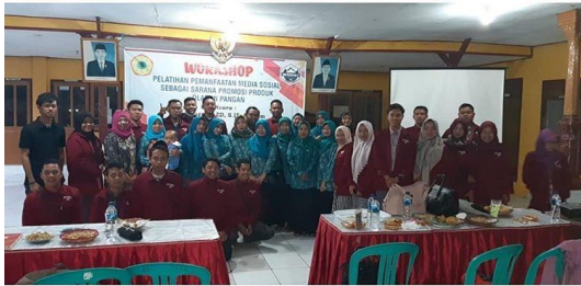
Foto : Workshop tentang media sosial