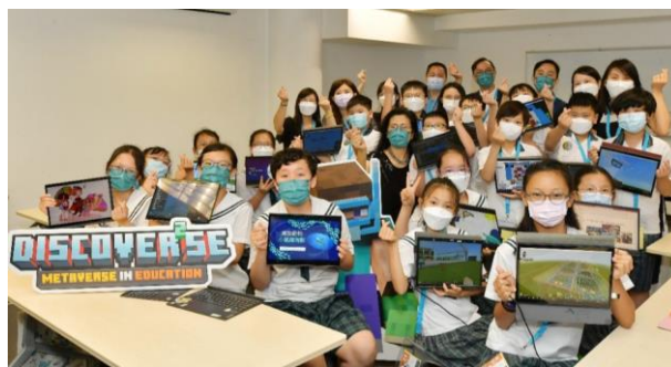
圖 2 學生展示元宇宙設計的作品