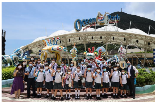
圖 3 實地考察活動

由海洋公園規劃全方位實地考察，讓學生產生同理心；由海洋公園聯誼專家線上訪談，以掌握準確、專業的海洋知識；由老師引導學生建構學習內容、訓練訪問及匯報技巧等，讓學生了解各海洋生物面對的挑戰及困難，再以小組合作學習的形式，在科技公司技術人員的指導下利用 Minecraft Education 建構，實現保育創意構想；透過元宇宙分享交流，宣揚保育意識，培育具有原始創新能力的人才。