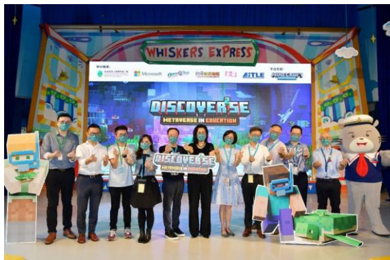
圖 1 「Discover 2 se - Metaverse in Education」啟動禮

「Discover 2 se - Metaverse in Education」計劃的構思源自於香港教師、學者的討論，為了讓學生及早認知未來及作出準備，透過「元宇宙」的多元經歷，培養數碼素養及「元宇宙」價值觀。學生身處 Metaverse 的世代，學習在元宇宙自處，掌握在虛擬世界的溝通協作技能和應有態度、學習保護個人私隱同尊重知識產權。更進一步，擴闊學生視野，除了學習履行世界公民的責任，更要肩負數碼公民的身份，認識自己在「元宇宙」充當的角色，及早認知未來，裝備自己。